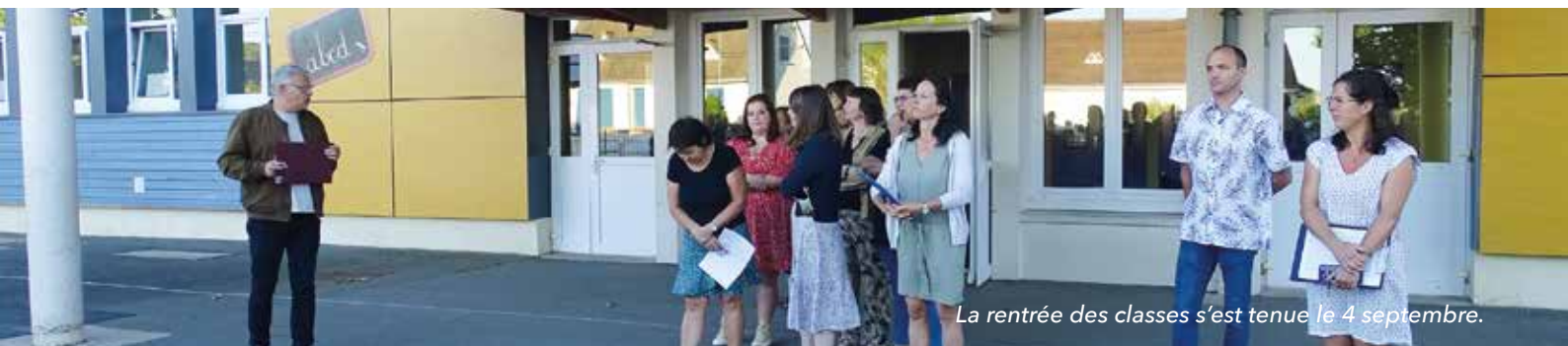
La rentrée des classes s'est tenue le 4 septembre.