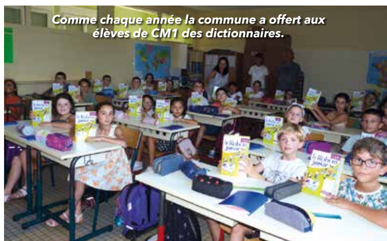
Comme chaque année la commune a offert aux élèves de CM1 des dictionnaires.