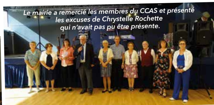
Le maire a remercié les membres du CCAS et présenté les excuses de Chrystelle Rochette qui n'avait pas pu être présente.