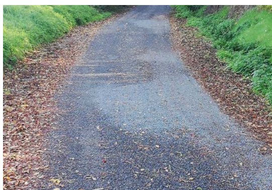
Nouvel enrobé au Chemin de la Folie