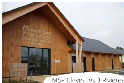
MSP Cloyes les 3 Rivières

Le Pays Dunois est la "porte d'entrée" des contrats avec l' Europe , l' Etat et la Région . En 25 ans, nous avons bénéficié de 41 millions d'euros de subventions qui ont permis de mobiliser 190 millions d'euros. Ces aides financières soutiennent la création d'emplois, des projets économiques, culturels, touristiques et sportifs qui participent à votre quotidien . Le Pays Dunois est le lieu par excellence de la concertation entre tous les acteurs : élus, administrations, associations, agriculteurs, acteurs sociaux.