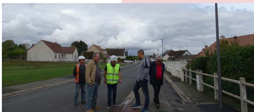
Fin de l'enfouissement des réseaux rue du Stade et rue des Roses