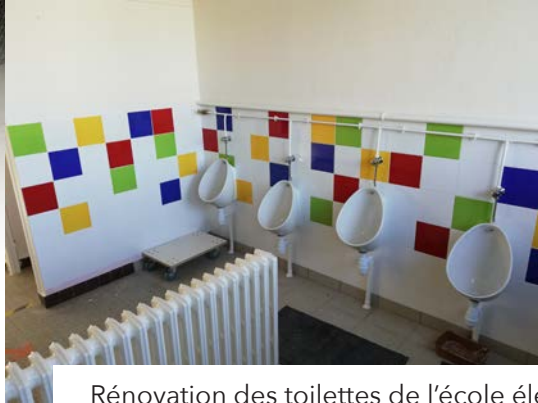
Rénovation des toilettes de l'école élémentaire par les services techniques

Remplacement de 91 lampes de l'éclairage public