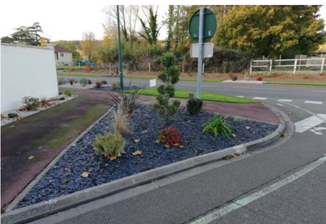
La Route Nationale a fait l'objet d'un nouvel aménagement paysagé.