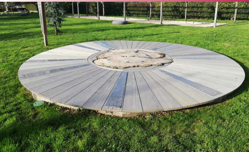
Les travaux sont terminés au parc de Lanneray