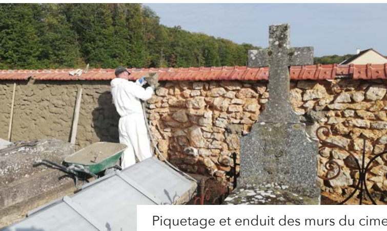
Piquetage et enduit des murs du cimetière de Lanneray par les services techniques