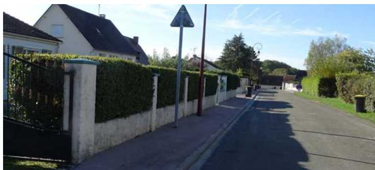
Les trottoirs rues du Meslay, des Bois, de la Monnetière, du Clos de la Croix, l'impasse du Pont Buché ont été goudronnés.